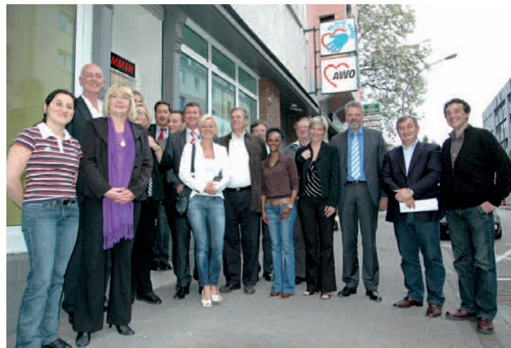
Die Blaue Hand – ein neues Angebot für Koblenz.

Der Kreisverband hat seit Mitte des vergangenen Jahres neue Leistungen im Angebot. Unter dem Titel „Blaue Hand“ werden Hausaufgabenbetreuung, die Seniortrainer-Ausbildung und familienstützende Dienste angeboten, zum Beispiel die duale Qualifizierung von alleinerziehenden Müttern und Kindern. Diese Angebote werden von vielen Sponsoren unterstützt, teilte der Kreisverband mit. Kontakt: Blaue Hand, Hohenzollernstraße 61, 56068 Koblenz, 0261 97372390. E-Mail: info@dieblauehand.de