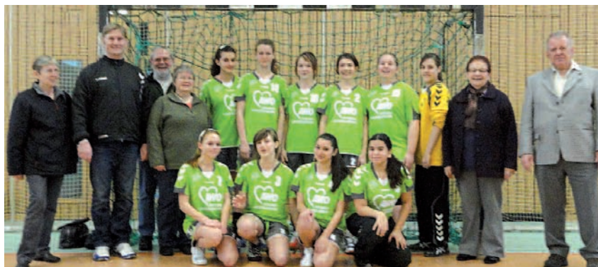
Ein kompletter Satz Trikots schmückt die weibliche Jugend.